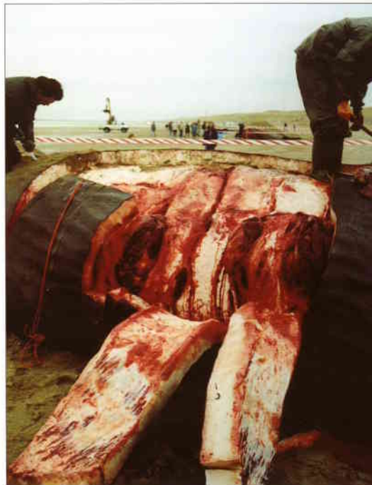
Vrijdagochtend: het afspekken is begonnen

nu al groot. Met een shovel worden rondom onze potvis palen het zand in geramd. De politie spant er rood-wit lint tussen. Ook werpt men alvast een dijk op rond elke potvis om het opkomende water te keren. Ons zeiltje met spullen ligt zo ook wat veiliger. Ik maak foto's van het afspekken. Een vrachtwagen met grijper bewijst goede diensten: hij trekt de repen los en voert ze meteen af. Om tien uur verschijnt de ploeg preparateurs van het Leidse NNM. Er wordt wat gemord over onze voortvarende aanpak, maar de onmisbare flensmessen en vleeshaken (nog van de 'Willem Barendsz') worden eerlijk verdeeld. De Leidenaren beginnen aan de middelste potvis. Smeenk meldt dat Museum Natura Docet in Denekamp ook belangstelling voor een skelet heeft getoond.