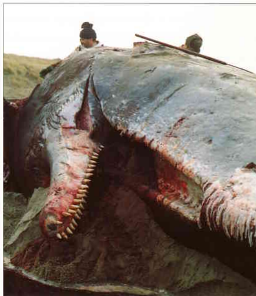
Zaterdagochtend: er druipt al spermaceti uit een 'litteken' in de kop